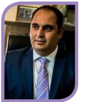
كلدو رمزي اوغنا

على الارض، على الانسان، على التراث والثقافة والهوية ، وهذه التجاوزات تقض عانقا امام تحقيق تطلعاتنا القومية، ولكون وجودنا القومي مهرون بالاراض والانسان والتراث والثقافة، فليعلم ان نكمل ما بدأه الاولون، اخذين بنظر الاعتبار الصعاب التي وقفت عانقا امام تحقيق كامل تلك التطلعات. ومن النماذج التي طالتنا هذه التجاوزات هي مدينة العريقة والزينة عنكاوة، فلا يخفى على احد الموقع المهم الذي تتبوءه هذه المدينة التي يحاكي تاريخها مدينة اربيلو العريقة، فعنكاوا اليوم هي بيت