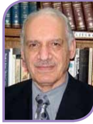
لا يسعني في هذه الذكرى الطيبة الا

خلال تلك الأحداث وبعدها أنتشر وشاع أسم زوعا في قرى وقصبات ومدن العراق كما انتشرت شعاراتها وبياناتها، وانني ما زلت أتذكر كيف كان الناس ومن جميع الاعمار